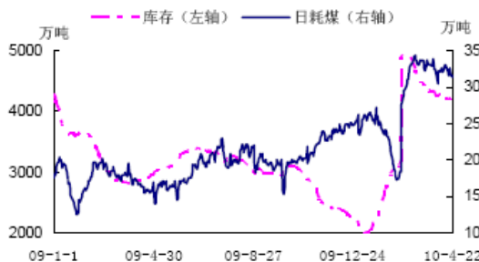
全国重点发电企业存煤、耗煤示意图