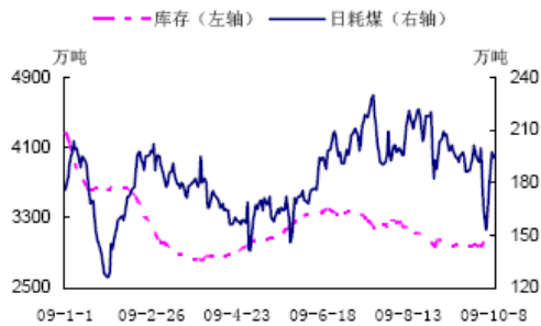
直供电厂存煤、耗煤示意图